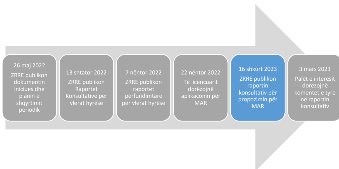
Figura 2 Procesi i shqyrtimit periodik

Propozimet e ZRRE për parametrat rregullativ, komentet e palëve të interesit dhe përgjigjet e ZRRE ndaj tyre janë të publikuara në faqen elektronike të ZRRE-së. Një përmbledhje e vlerave të vendosura është dhënë në nën-kapitujt 3.1-3.4, më poshtë.